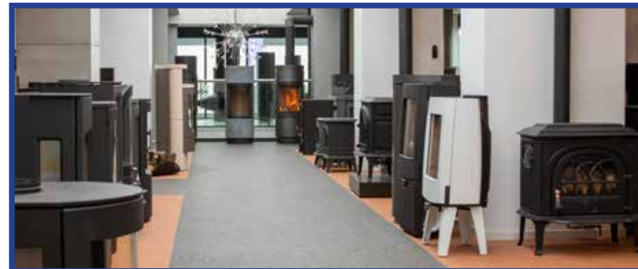
Bovenverdieping met vrijstaande haarden